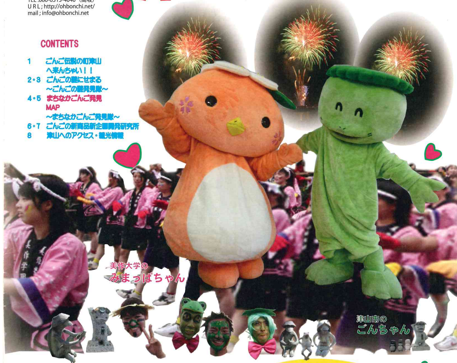
美作大学の みまっちゃん