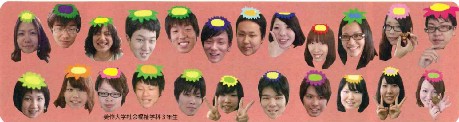
美作大学社会福祉学科3年生

この情報紙は、美作大学3年生まちおこし情報紙づくり演習受講生と、同校まちおこし情報紙サークル『チーム OH!BONCHI!!』の共同製作です。ムリなお願ひにも快く商品開発にご協力下さったみなさま、つたない取材や数々の厚かましいお願ひにも、親切、ていねいにご協力下さったみなさま。いろんな人にお世話になりました。盆地津山人は、ホントにやさしくて温かい。あらためて津山ってステキだなんて思いました。