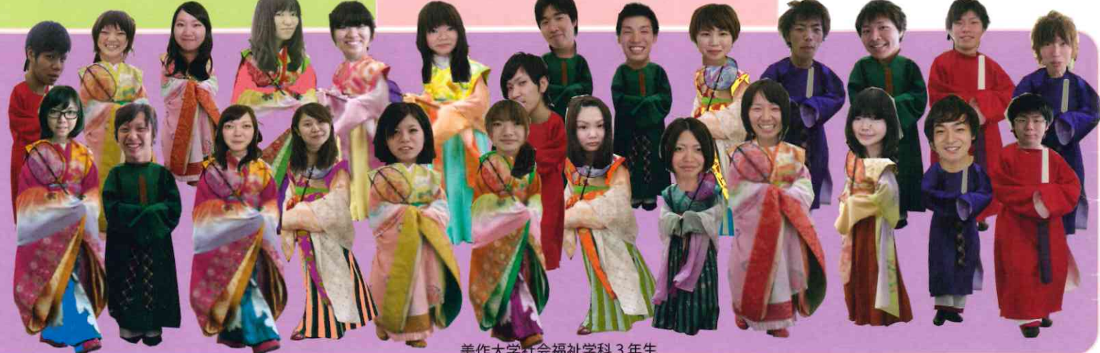
美作大学社会福祉学科3年生

★観光センターレンタサイクル ◎普通自転車 料金2時間400円 一日1,000円 ◎電動自転車 料金2時間600円 一日1,500円 ★城東地区 レンタサイクル ◎自転車の末沢 津山市材木町19 0868-22-2868 料金 2時間300円 一日600円 9時~18時 ★美作三湯 美作の国は昔からたくさんの温泉が湧き出る湯の国です。なかでも、湯原・奥津・湯郷の3つの温泉は「美作三湯」と呼ばれ、昔から多くの人々に親しまれている温泉地です。またその実力は、全国露天風呂番付で西の横綱に「湯原」、前頭に「奥津・湯郷」がランクされているほど。美作国めぐりの旅に、この3つの温泉地をとりいれてプランしてみたいかたがどうでしょう? (美作観光連盟ホームページより加筆) http://www.bikanren.sakura.ne.jp/