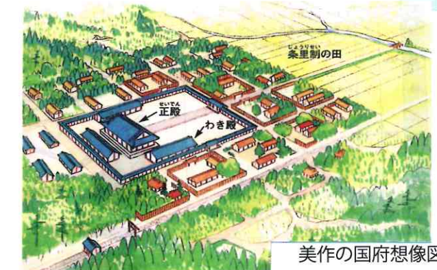
イラスト:「わたしたちの津山の歴史」津山市教育委員会より