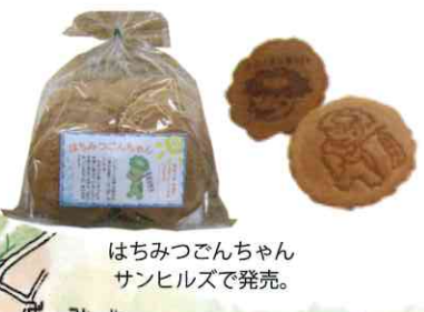
はちみつごんちゃん サンヒルズで発売。