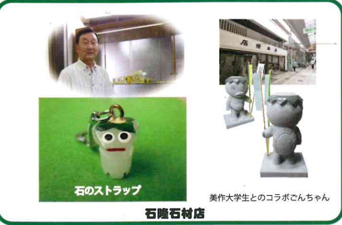
石のストラップ 石隆石村店 美作大学生とのコラボごんちゃん