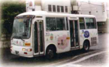
ごんごバス 春夏秋冬のごんごイラストもかわいい♡ 詳しく知りたい方は、ネットで見てネ