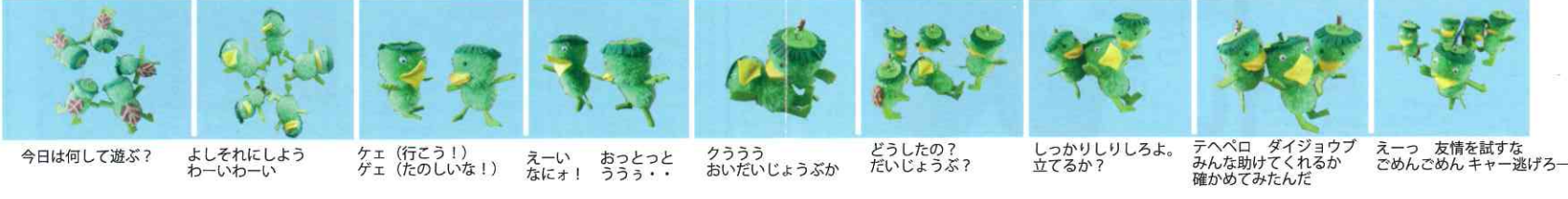
今日は何して遊ぶ? よしそれにしようわーいわーい ケエ(行こう!)ゲエ(たのしいな!) えーい なにオ! おっととつうらう... クラウラ おいだじょうぶか どうしたの? だじょうぶ? しっかりしりろよ。立てるか? テヘペロ ダイジョーブ みんな助けてくれるか 確かめてみたんだ えーっ 友情を試すな ごめんごめん キャー逃げろー