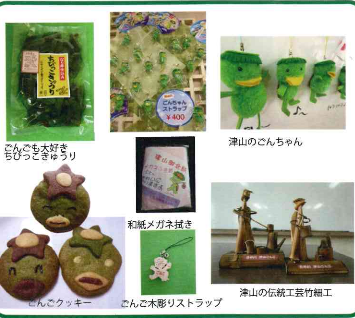
ごんごも大好き ちびっこきゅうり 津山のごんちゃん 和紙メガネ拭き ごんごクッキー ごんご木彫りストラップ 津山の伝統工芸竹細工