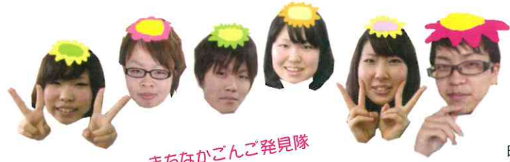
まちなかごんご発見隊