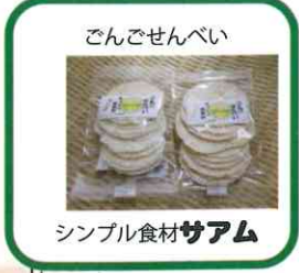
ごんごせんべい シンプル食材サアム