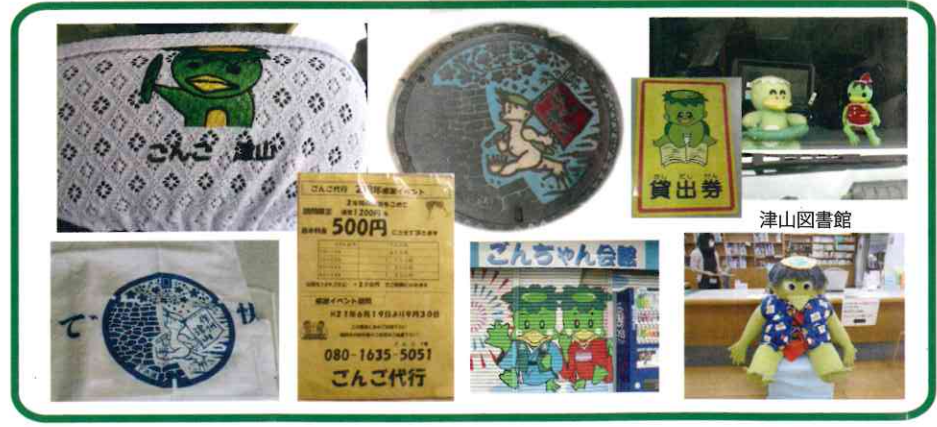
津山図書館 ごんちゃん会 ごんご代行 080-1635-5051