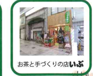
お茶と手づくりの店いぶ