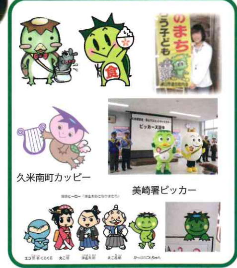
久米南町カッピー 美崎署ピッカー