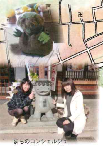
まちのコンシェルジュ リカッパ&ナカッパ

ごんご出現地 のぞき淵 まちの事情通によると、津山に伝わる古式泳法 神伝流の名手でも、ここはカッパに足をとられ るのでぶち気をつけると言われている とか。