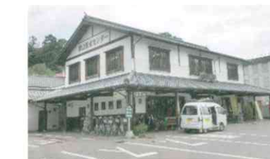
津山観光センター

山下 97-1 Tel: 0868-22-3310 開 / 9:00 ~ 19:00 (10月 ~ 3月は ~ 17:00) 休 / 月 (祝祭日の場合は翌日)